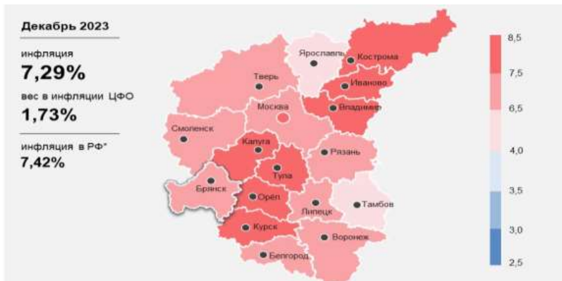
Рисунок 1 – Инфляция Брянской области в сравнении с другими регионами

В декабре 2023 года годовая инфляция в Брянской области практически осталась на прежнем уровне, составив 7,29% по сравнению с 7,28% в ноябре того же года. В Центральном федеральном округе и по всей Российской Федерации наблюдалось замедление годовой инфляции — до 7,41% и 7,42% соответственно. Увеличение расходов производителей и поставщиков, а также высокий спрос на отдельные товары длительного пользования стали причиной ускорения годового роста цен на товары как продовольственные, так и непродовольственные. В то же время, из-за исключения из расчетов инфляции декабрьской индексации тарифов 2022 года на отдельные виды услуг, годовой рост цен в сфере услуг замедлился [4].